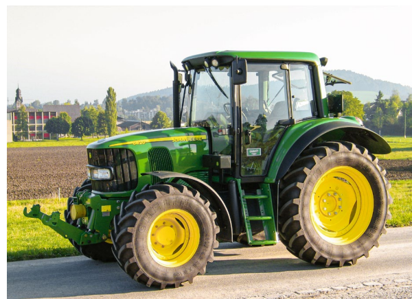
Tab. 3: Beispiel Kostenberechnung für Traktor 70 kW (95 PS), Nr. 1005